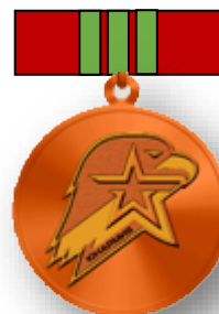
Бронзовый знак юнармейской доблести