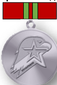
Серебряный знак Юнармейской доблести