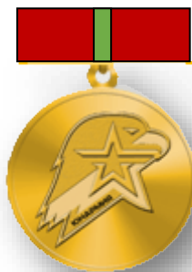
Золотой знак юнармейской доблести